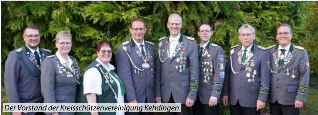
Der Vorstand der Kreisschützenvereinigung Kehdingen

Ein ganz besonderes Jubiläum durften die Kehdinger Schützen in diesem Jahr feiern: 100 Jahre Kreisschützenvereinigung Kehdingen. Seit 1925 verbindet sie die Schützenvereine der Region, damals wie heute mit dem Ziel, den sportlichen Wettkampf zu fördern und die Gemeinschaft zu stärken.